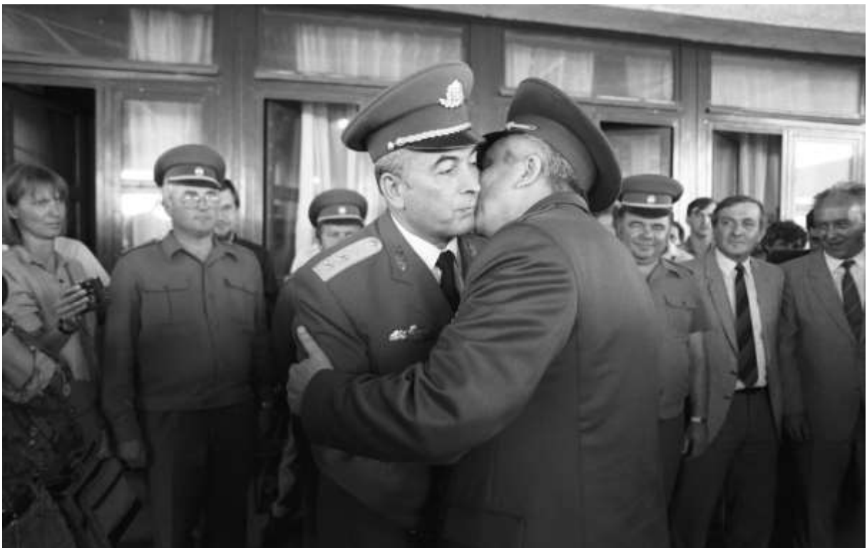
Annus Antal altábornagy, a Honvédelmi Minisztérium államtitkára (b) ünnepélyes keretek között búcsút vesz Viktor Silov (j) altábornagytól / Fotó: MTI

A következő fotón azért érdemes elidőzni. Annus Antal altábornagy, a Honvédelmi Minisztérium államtitkára ünnepélyes keretek között búcsút vesz Viktor Silov altábornagytól / Fotó: MTI